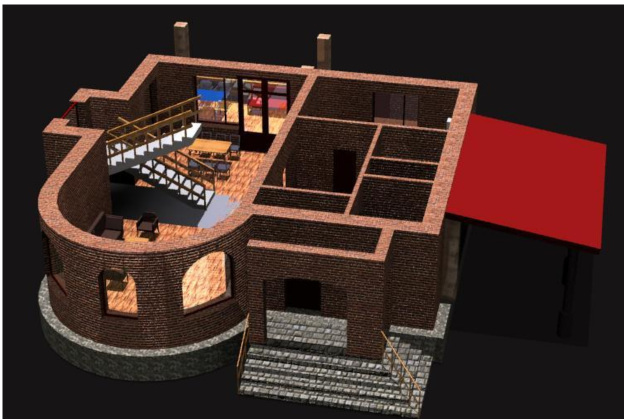
Рис. 3 Трехмерная модель первого этажа с частичной расстановкой мебели