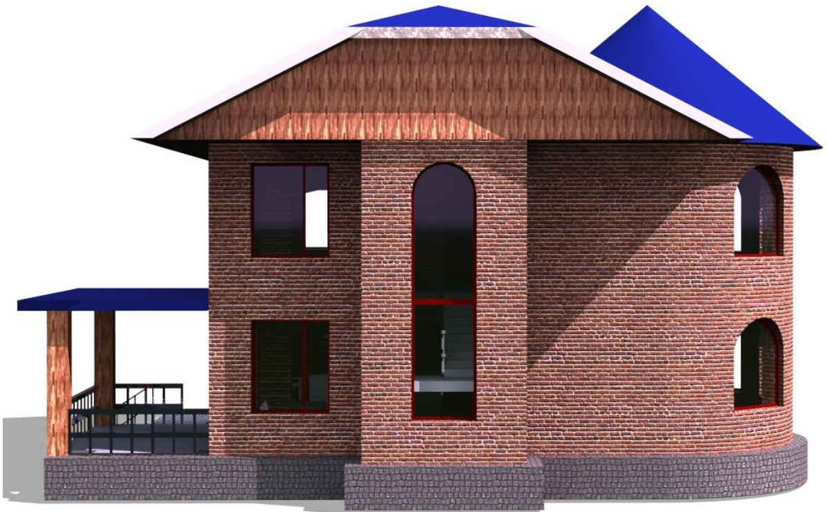
Рис.5 Вид слева