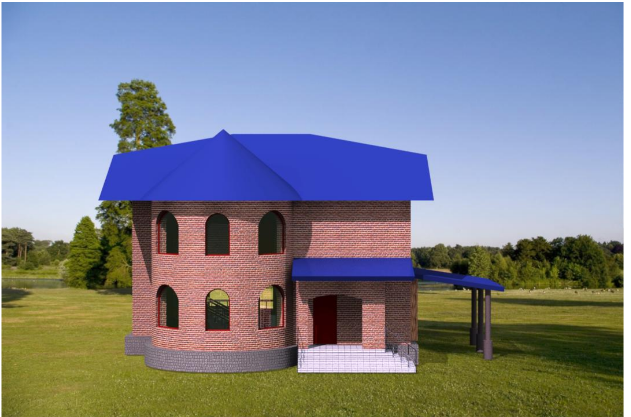
Рис.8 обработка 3D- модели в библиотеке фотореалстики