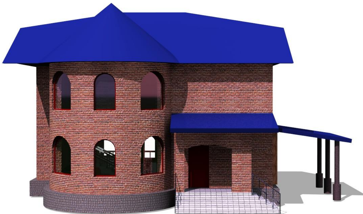
Рис.6 Вид справа