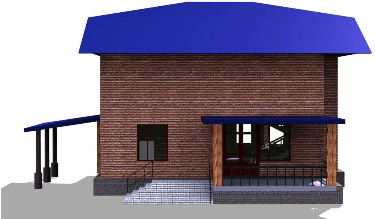
Рис.4 Вид сзади