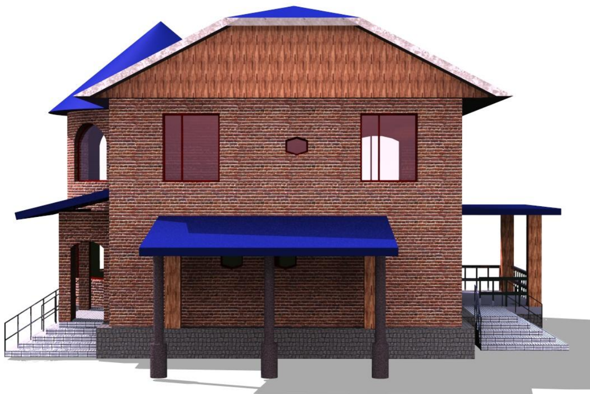
Рис.7 Вид спереди